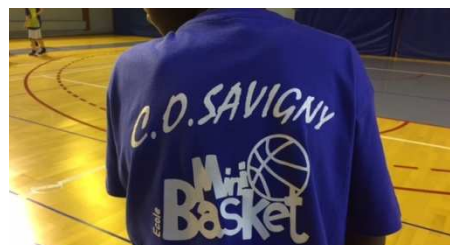
L'équipe d'encadrement de L'école de basket.

Très bonnes fêtes de fin d'année à tous et toutes. A bientôt.