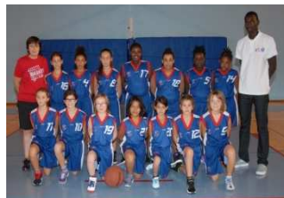
U11F 1 & 2