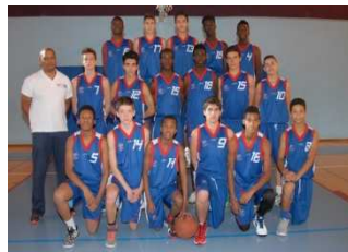
U 17 M