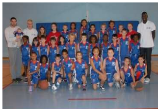
Ecole 1 & 2